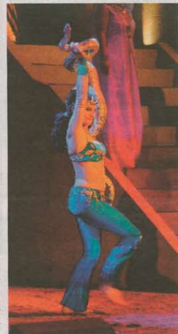
Zur orientalischen Stimmung trägt auch ein Tanz mit echter Schlange bei.

Eintrittskarten sind auch erhältlich unter www.clingenburg-festspiele.de und für alle Nachmittags- und Abendvorstellungen auch bei www.adticket.de sowie in den bekannten Vorverkaufsstellen.