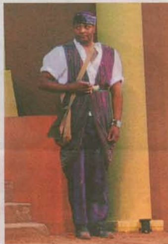
Findet für alle Gelegenheiten die passenden Worte und hält geschickt die Fäden in der Hand: Mereb, ein nubischer Sklave.

Die Inszenierung verquickt das Früher mit dem Heute: Insgesamt 70 moderne und historisierende Kostüme sowie farbenfrohe Kleider hat Ulla Birkelbach schneiden lassen, die allein für sich ein Fest für die Augen sind. Die Maskengestaltung realisieren die Maskenbildner Hannie und Gerard de Lobie. Alles spielt vor dem Hintergrund einer prächtigen Akzente setzenden Kulisse (Bühnenentwurf Marcel Krohn, Realisierung Sven Seidel, der auch für das Lichtdesign verantwortlich zeichnet).