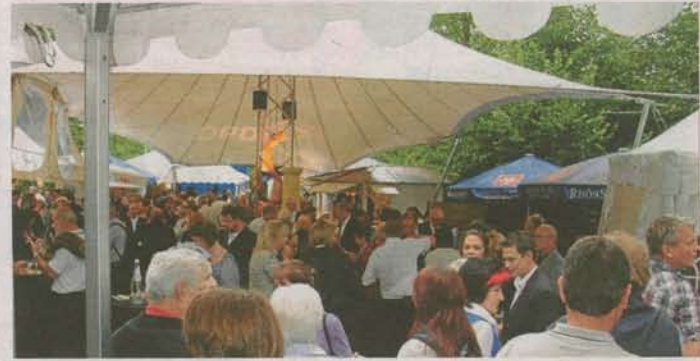
Knapp 800 Zuschauer genießen die eindrucksvolle Premiere.

Jahren geschrieben hat. Eine neue Tonanlage garantiert, dass auch der leiseste Ton bis in die hinteren Ränge klar zu hören ist (Horst Deller).